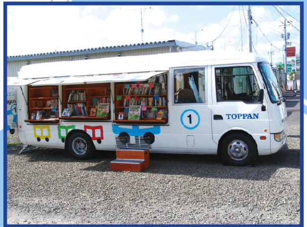
2012年6月28日 宮城県仙台市七郷中央公園仮設住宅地にて